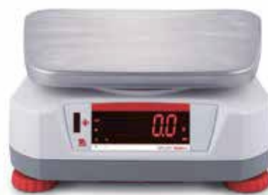
Тыльный дисплей со встроенным бесконтактным датчиком.

Используя два ярких светодиодных дисплея (передний и задний), одновременно несколько операторов могут выполнять однотипные операции взвешивания на одних и тех же весах. Даже в не самых благоприятных условиях большие яркие дисплеи позволяют без труда считывать результаты взвешивания с большого расстояния. Благодаря двум дисплеям весы также удобно использовать в розничной торговле. Наличие больших дисплеев спереди и сзади позволяет использовать весы Valor 4000 в розничной торговле, где покупатель должен видеть вес взвешиваемого товара.